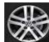
Alanta de 16"