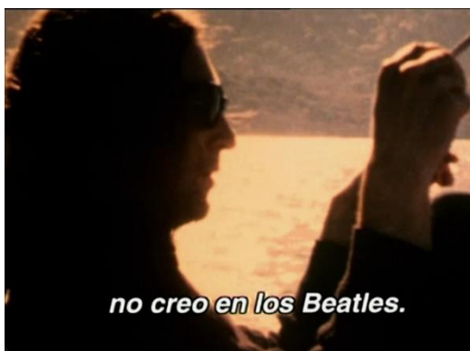
Campaña ¿Crees en Golf?, 1998

La campaña "¿Crees en Golf?", de 1998, que intercalaba imágenes históricas mientras sonaba el tema "God" de John Lennon; así como el anuncio emitido en 2013 "Muchas veces imitado. Nunca igualado" del Golf GTI, en el que cantantes 'amateur' versionaban "My way" de Frank Sinatra; o la reciente campaña "Como un Golf no es un Golf", que en 2019 adaptó la letra de la canción infantil "If you're happy and you know it", son claros ejemplos de que el imaginario colectivo, la música y la cultura popular son los perfectos aliados de la publicidad.