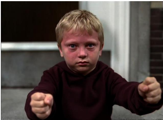
Campaña Cambio DSG, 2005

El humor ha sido una de las constantes en la publicidad de Golf y ha servido, tanto para mostrar nuevas tecnologías que incorporaba el coche, como para ahondar en el posicionamiento aspiracional del Golf.