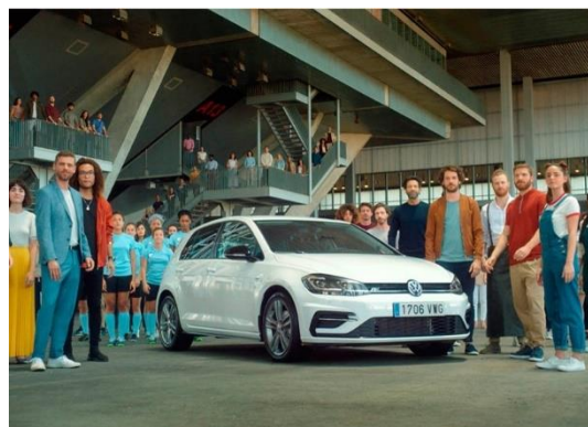
Campaña Como un Golf no es un Golf, 2019