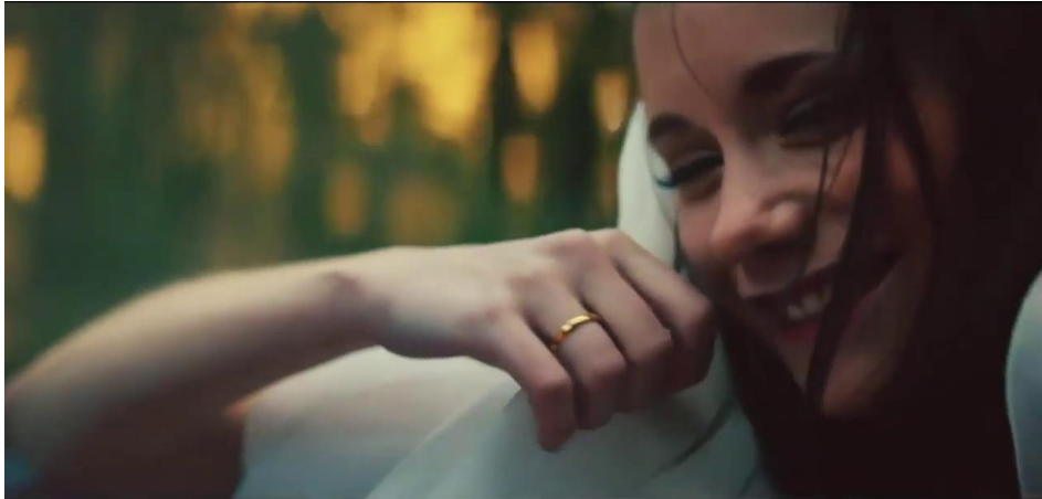
Campaña Tu vida, tu Golf, 2020

La campaña publicitaria del Golf 8 hace referencia, precisamente, al hecho de que el Golf es un modelo que "siempre ha estado ahí". Con el claim 'Tu vida tu Golf', la marca ha querido evocar todas las historias que los clientes han vivido con este emblemático modelo.