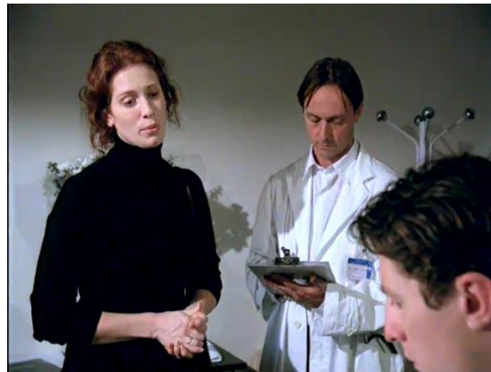
Campaña Amnesia, 2000